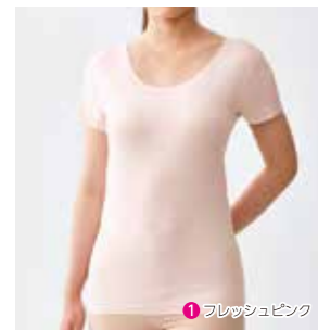
① フレッシュピンク